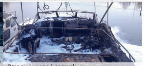
Brann slukket på normalt vis. Et ekstremt stort oppryddingsarbeid gjenstår.

BlazeCut er et selvutløsende brannslukningssystem for alle typer kjøretøy og elektriske skap. Om en brann skulle oppstå vil det bli et hull i slangen der flammene er som varmest. På kun et par sekunder vil gassen fra slangen slukke hele brannen. Ettersom gassen ikke legger igjen restprodukter