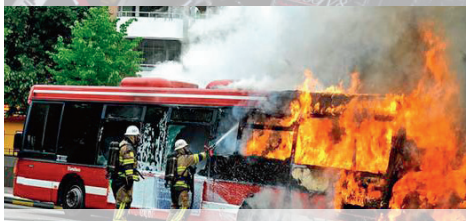
Motorbrann som kunne vært forhindret.