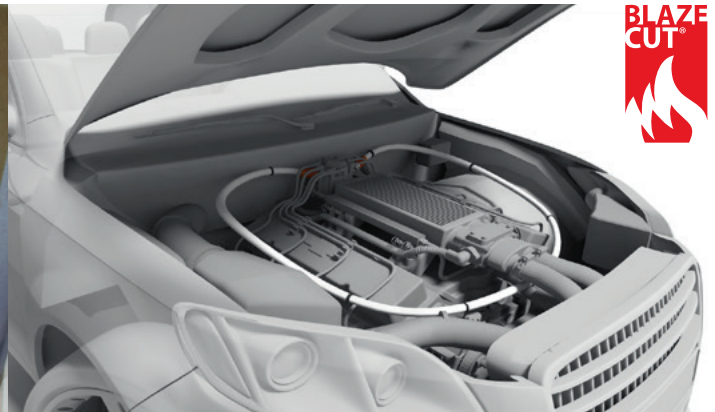
Eksempel på montering i bil.